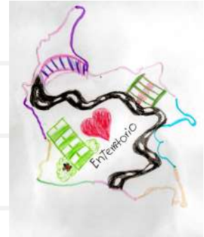
Isabella Tapias Muñoz - 9 años