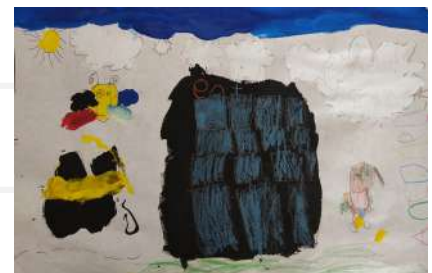
Antonella Arizala Cabrera - 5 años