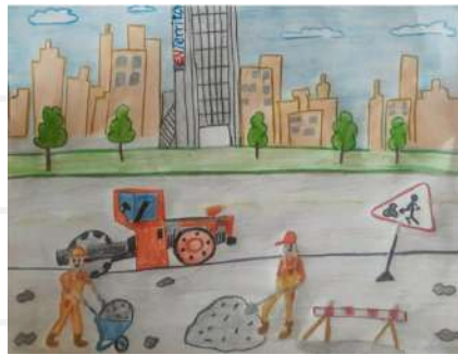
Wesley Sneijder Lara Ballesteros - 7 años